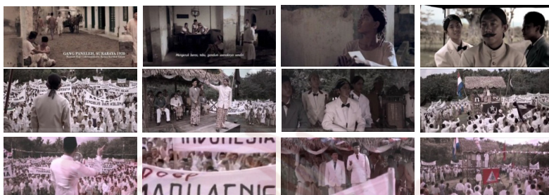
Gambar 1. Adegan Soekarno muda indokos dan menjadi murid dari HOS Cokroaminoto. Ia mengikuti aktivitas pergerakan di organisasi Sarekat Islam dan belajar berorasi kepada HOS Cokroaminoto hingga kemudian Soekarno berorasi saat mendirikan Partai Nasioanl Indonesia (PNI) di Bandung.