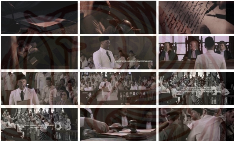
Gambar 3. Adegan Soekarno di dalam penjara menyusun naskah pembelaannya yang kemudian diberi judul Indonesia Menggugat dan dibacakannya di depan pengadilan di gedung Landraad Bandung sehingga menimbulkan kekisruhan dan memicu api protes dan rasa nasionalisme dari pengunjung yang menyaksikan sidang atas diri Soekarno.

Data menunjukkan gambar sequence Soekarno menulis sendiri pledoi pembelaan di dalam balik jeruji sel penjara yang akan dibacakan pada saat sidang nantinya. Pembelaan yang disusunnya kemudian dikenal dengan istilah Indonesia Menggugat yang kemudian dibacakannya di Landraad Bandung. Data intertekstual menunjukkan adanya penguatan