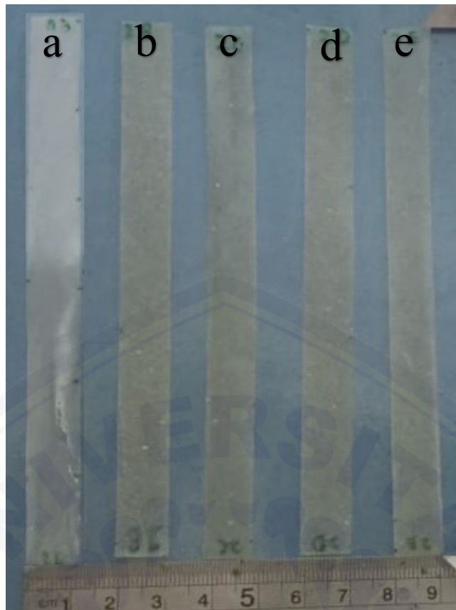
Gambar 1. Sampel dengan variasi konsentrasi serat a) 0%, b) 2%, c) 4%, d) 6% dan e) 8%.