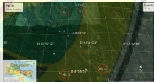
Gambar 2. Posisi koordinat empat stasiun penelitian (Google Earth Pro, 2018)

Parameter fisika dan kimia air sungai diukur secara in situ . Parameter fisika yang diukur meliputi debit, kecerahan, suhu, warna, dan bau air sungai, sedangkan parameter kimianya meliputi oksigen terlarut (DO) dan pH.