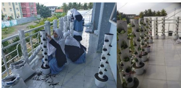
Gambar 3. Budidaya Sayuran Organik secara Vertikultur

kepada peserta. Kegiatan praktik dilakukan dengan melibatkan para santri aktif secara langsung sehingga para santri lebih mudah dalam memahami serta ketrampilan santri dapat meningkat. Keterlibatan santri dimulai dari proses awal sampai proses akhir dalam demonstrasi, setiap peserta diberikan kesempatan dalam bertanya serta berdiskusi dengan pemateri dan peserta.