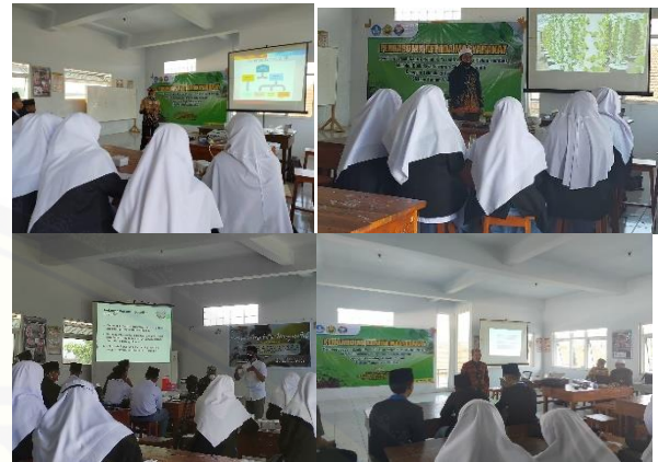
Gambar 2. Sosialisasi dan Pemberian Materi

peserta tidak memahami materi yang akan diberikan dan belum menguasai tekniknya.