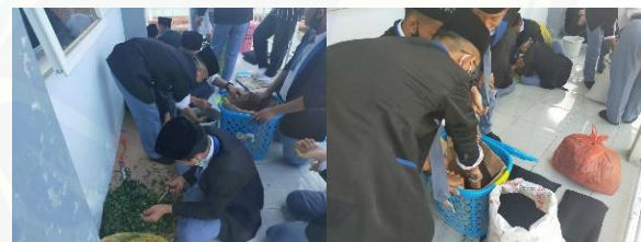
Gambar 2. Pembuatan Pupuk Organik dengan Pengomposan Takakura

Pelatihan dilanjutkan dengan pemberian materi berupa pemaparan langsung dan modul pelatihan. Metode pemberian materi dilakukan secara klasikal dan praktek dilakukan dengan berkelompok. Topik materi yang diberikan merupakan tahapan budidaya sayur, mulai dari persiapan media tanam, hingga penanaman dan panen. Kegiatan diskusi pada pelatihan merupakan tanya-jawab antar sesama peserta. Kegiatan tersebut diharapkan untuk menghidupkan suasana diskusi dan pertanyaan-pertanyaan peserta dapat langsung terselesaikan atau tuntas terjawab.