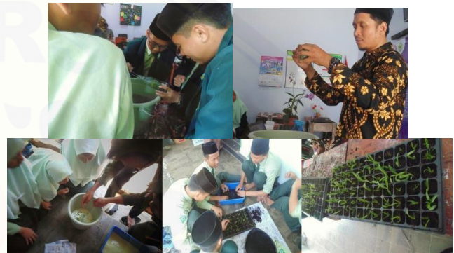
Gambar 2. Praktek aklimatisasi anggrek

Pelatihan dilanjutkan lewat penyampaian modul, tata cara penyampaian modul dicoba secara klasikal. Penyampaian modul juga memberikan peluang kepada para santri untuk aktif bertanya secara langsung dan berdiskusi dengan sesama santri yang lain. Tata cara ini lebih baik dalam menghidupkan atmosfer dialog sebab kesusahan yang dialami para santri bisa ditanyakan secara langsung dan dicarikan solusinya