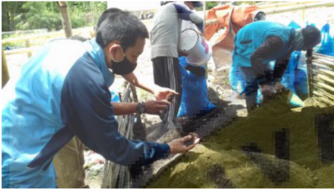
Gambar 7. Menguji Kualitas Biochar