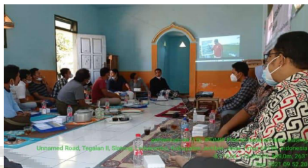
Gambar 5. Kegiatan Sosialisasi Pertanian Organik