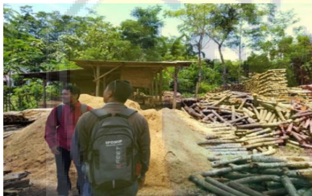
Gambar 1. Pabrik Pengergajian dan Limbah Serbuk Sengon

Tanaman sengon yang di tanam di sekitar kaki gunung melimpah sehingga beberapa penduduk di Desa Slateng mendirikan pabrik pengergajian sengon, dan terdapat 4 pabrik pengergajian sengon. Kegiatan pengergajian sengon menghasilkan limbah berupa serbuk gergaji. Serbuk gergaji di tiap pabrik menempati luasan yang cukup luas dan memakan tempat (Gambar 1). Waktu musim hujan akan menimbulkan bau karena limbah serbuk gergaji yang mulai membusuk karena basah serta menimbulkan pencemaran air saat terikut air di selokan.