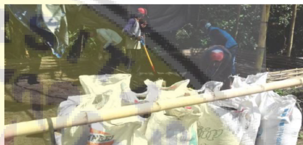
Gambar 6. Peran Aktif Peserta Dalam Pembuatan Biochar

Salah satu pertanyaan peserta dan keantusiasan peserta dalam penerapan pertanian organik yaitu kemudahan dalam membuat biochar sebagai modal awal pertanian organik. Biochar dibuat tidak membutuhkan waktu yang lama seperti pembuatan pupuk dengan biodekomposer yang membutuhkan waktu minimal 3 minggu. Waktu yang dibutuhkan dalam pembuatan biochar cukup 3-5 jam dengan dijaga agar tidak muncul api dan dijaga saat mau terbakar seluruhnya, harus disiram air agar tidak sampai menjadi abu.