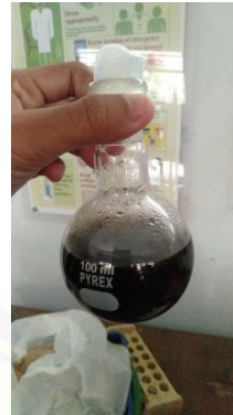
(hasil pemurnian ulang destilasi)