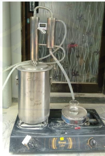
Gambar 7. Penerapan teknologi ekstraksi minyak atsiri kulit jeruk untuk penduduk Desa Sidomekar

Berdasarkan hasil kedua metode tersebut dilakukan proses scale up dengan mendesain alat dan metode yang nantinya diterapkan di Desa Sidomekar. Rancang teknologi ekstraksi minyak atsiri yang akan diberikan ke penduduk Desa Sidomekar tertera pada Gambar 7. Prinsip ekstraksi minyak atsiri dengan menggunakan alat ini adalah destilasi. Berdasar hasil uji skala laboratorium, proses ekstraksi yang paling efektif adalah dengan menggunakan metode ekstraksi soxhlet (suhu ekstraksi 50°C selama 5 jam) dimana dalam metode soxhlet terjadi kontak antara bahan baku dengan pelarut secara berulang [9]. Oleh sebab itu dilakukan kombinasi metode ekstraksi yakni maserasi (5 jam) dan destilasi. Penggunaan metode maserasi merupakan langkah untuk mengekstrak minyak atsiri secara optimal dengan adanya kontak langsung antara pelarut etanol dengan bahan baku kulit jeruk. Adanya proses tersebut menyebabkan terjadinya transfer massa, dimana minyak atsiri pada kulit jeruk dapat keluar dari matriks karena adanya interaksi fisik (berupa ikatan hidrogen) dengan pelarut etanol. Hasil yang diperoleh berupa campuran minyak atsiri dan etanol didestilasi (suhu operasi 63°C) untuk memperoleh minyak atsiri murni. Bagian destilat merupakan etanol sementara minyak atsiri tertinggal di bagian residu adalah minyak atsiri dan sisa bahan baku.