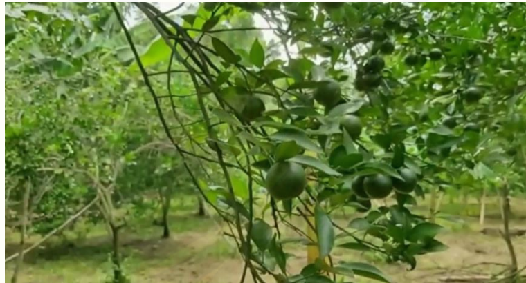
Gambar 1. Lahan yang Ditanami Jeruk Semboro

Berdasarkan data dari Desa Sidomekar tahun 2020, jumlah penduduk di Desa Sidomekar adalah 13.979 orang. Jumlah penduduk laki-laki 6.969 orang dan perempuan 7.010 orang [1]. Jumlah penduduk yang bekerja adalah 6824 orang. Pekerjaan penduduk Desa Sidomekar mayoritas adalah wiraswasta dan petani. Pekerjaan lain meliputi tukang, TNI/POLRI, perawat, bidan, PNS, dan buruh tani. Roda perekonomian desa salah satunya digerakkan dengan adanya pasar. Di Desa Sidomekar hanya ada 1 pasar yaitu pasar krempyeng yang buka pada siang hari dan tidak memiliki bangunan tetap. Desa Sidomekar belum memiliki produk unggulan desa yang menjadi ciri khas oleh-oleh dari desa tersebut. Salah satu hasil pertanian yang menonjol dari Desa Sidomekar adalah jeruk semboro. Hasil panen jeruk biasanya dijual ke pengepul dengan harga jual rendah, bahkan ketika harga jeruk sedang jatuh nilai jualnya hanya Rp 2.000 per kg. Industri yang khusus mengolah jeruk ataupun membuat diversifikasi produk dari bahan baku jeruk di Desa Sidomekar juga belum ada. Padahal lahan pertanian yang ditanami jeruk seluas 25 ha dengan hasil panen 7 ton/ha sehingga membuka potensi jeruk sebagai bahan baku produk unggulan desa [1]. Contoh lahan yang ditanami jeruk dapat dilihat pada Gambar 1, sedangkan buah jeruk semboro dapat dilihat pada Gambar 2.