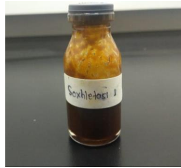
(minyak atsiri hasil ekstraksi soxhlet)