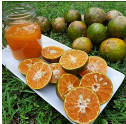
Gambar 2. Jeruk Semboro