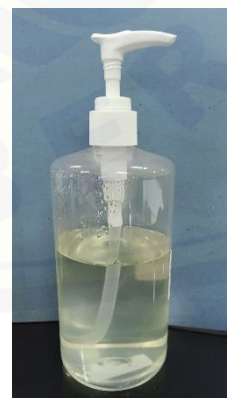
( hand sanitizer gel)