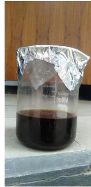
(hasil scale up )

dengan metode destilasi atau evaporasi untuk memperoleh kemurnian yang lebih tinggi. Hasil proses scale up ekstraksi minyak atsiri kulit jeruk tertera pada Gambar 8.