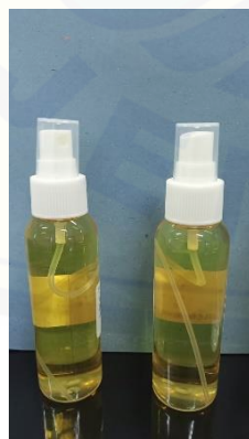
( hand sanitizer cair)

Proses pembuatan hand sanitizer mengikuti formulasi yang telah ditetapkan oleh World Health Organization (WHO). Formulasi hand sanitizer sesuai standar WHO ini berbasis alkohol 70% atau lebih. Formulasi ini menjadi standar utama untuk menjaga kebersihan tangan. Ada dua formulasi bahan dasar untuk membuat hand sanitizer versi WHO, yakni menggunakan etanol 96% berukuran 8.333 ml dan isopropil alkohol 99,8% berukuran 7.515 ml, sedangkan bahan sisanya menggunakan hidrogen peroksida 3% berukuran 417 ml, gliserol 98% berukuran 145 ml dan air distilasi [10]. Selanjutnya, essential oil jeruk dan kulit jeruk ditambahkan sebanyak 3 % dari volume bahan dasar. Hasil hand sanitizer cair dan gel tertera pada Gambar 9.