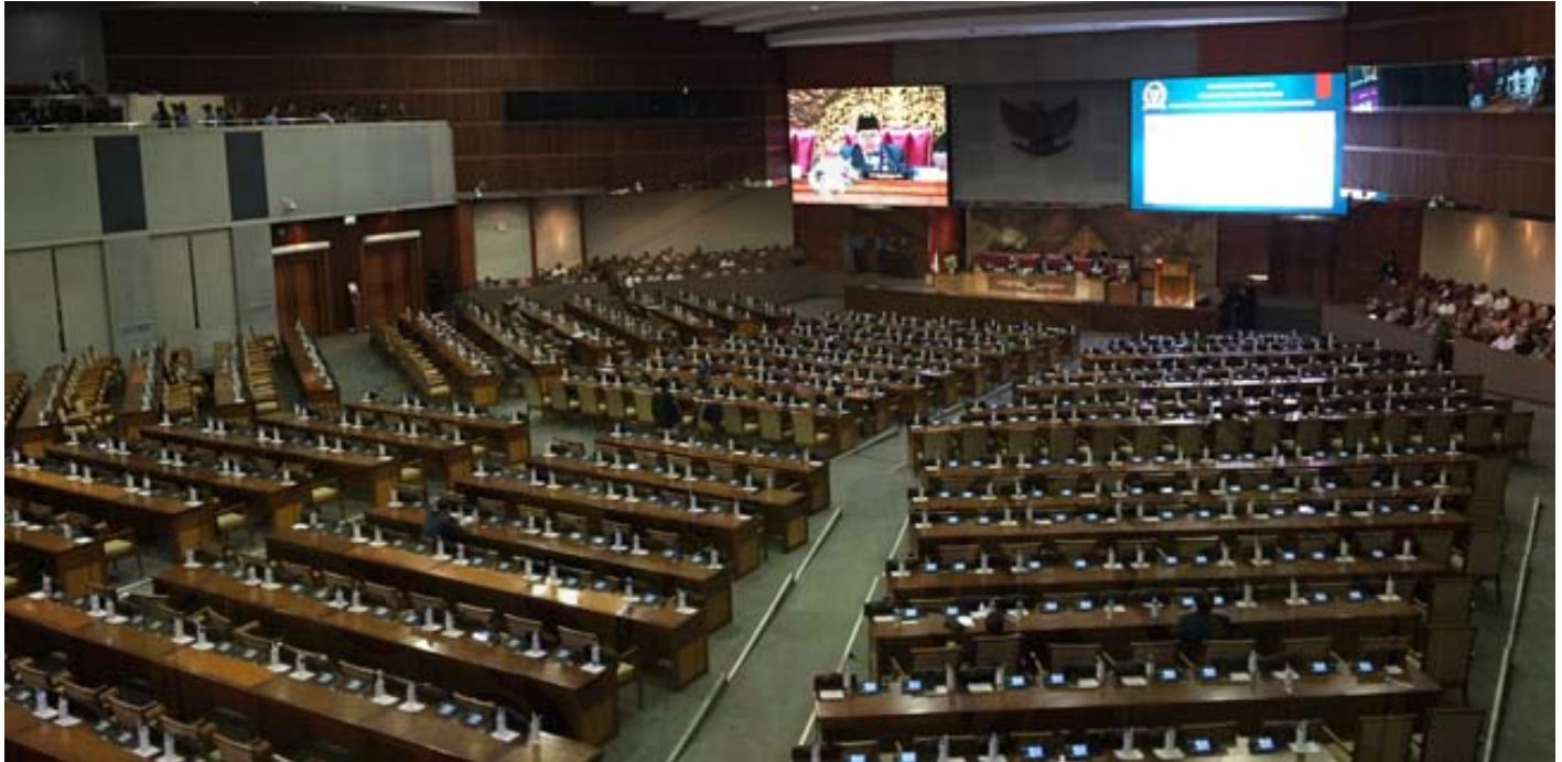
Ilustrasi paripurna pengesahan revisi UU KPK

TIDAK acuh pada seruan nurani publik, pemerintah dan DPR telah bermufakat atas revisi Undang-Undang tentang Komisi Pemberantasan Korupsi (UU KPK). Kesepakatan tersebut dinilai cacat moral oleh banyak pihak karena selain keganjilan dalam hal prosedurnya, secara substantif ia bukannya menguatkan KPK sebagaimana menjadi harapan publik tetapi justru sebaliknya malah melemahkan KPK.