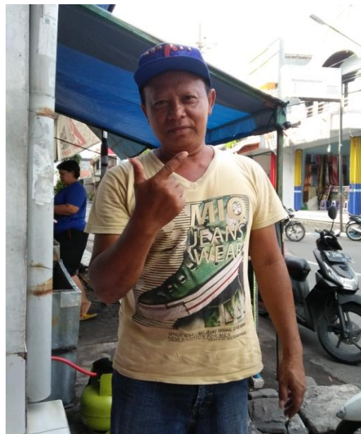
Informan Masyarakat Sekitar