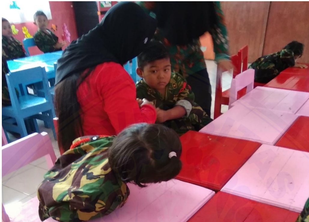
Gambar 1. Anak yang memiliki kelekatan cemas