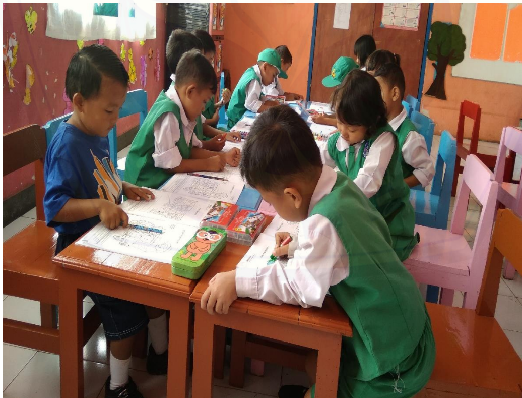
Gambar 2. Proses pembelajaran TK Kartika IX-35