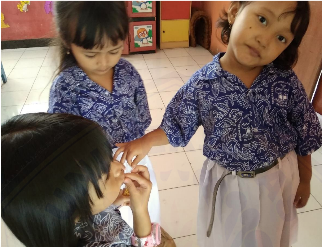
Gambar 3. Anak berbagi makanan