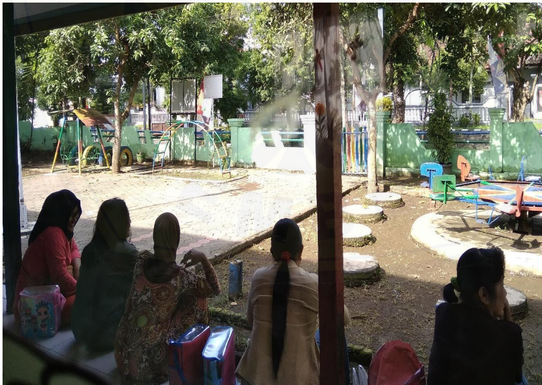
Gambar 4. Sebagian orang tua yang menunggu anaknya