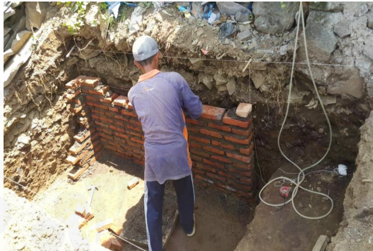
Gambar 4. Pembangunan Saluran Pembuangan Dan Penampungan Air

air yang akan digunakan untuk kegiatan produksinya, oleh karena itu, tim juga memberikan bantuan untuk memasang dan mendesain sistim saluran air yang akan digunakan.