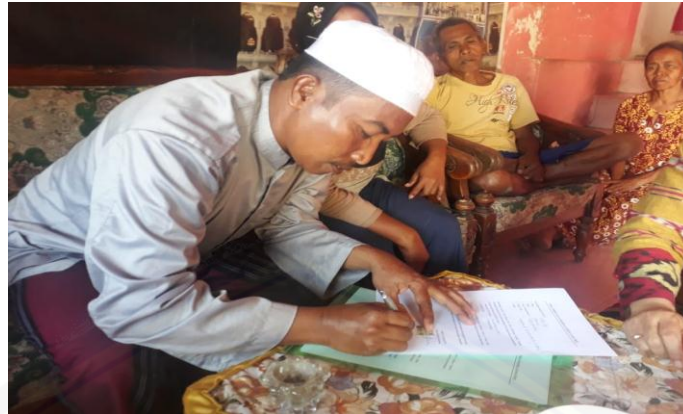
Gambar 6. Tanda Tangan Serah Terima Bantuan Mesin Pemotong Batu Piring Kepada Mitra