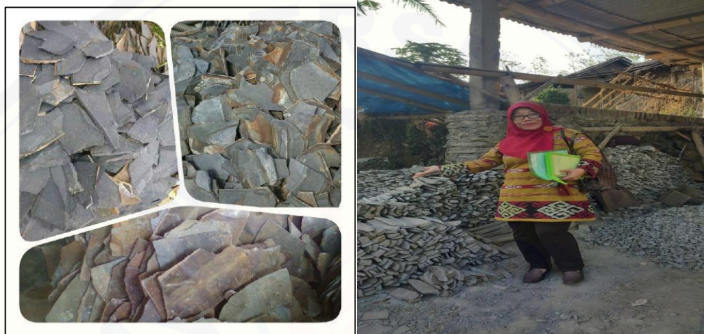
(a) Batu Piring yang Belum Diproses

oleh penduduk Dusun Krajan II Desa Sukowiryo. Dalam proses produksi kerajinan batu piring, bahan baku batunya tidak dihasilkan dari desa Sukowiryo sendiri melainkan diperoleh dari Kecamatan Kalisat, akan tetapi jaraknya justru lebih dekat dengan Desa Sukowiryo karena langsung berbatasan dengan kecamatan Kalisat, sehingga transportation cost bisa ditekan.