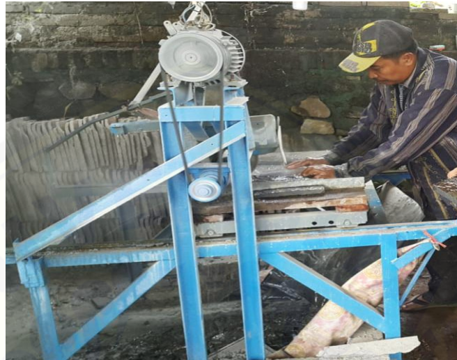
Gambar 5. Bentuk Mesin Pemotong Batu Piring Yang Telah Di Modifikasi Dan Diserahkan Kepada Mitra

mitra sebagai bukti telaksananya kegiatan pengabdian PPP yang telah diusulkan.