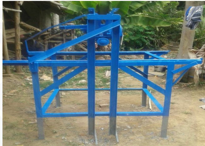
Gambar 3. Kerangka Meja yang Akan Dipasangkan alat Pemotong Batu Piring

performa yang masih baik sehingga masih dapat digunakan dalam jangka panjang. Selain pembelian mesin, untuk memodifikasi alat pemotong batu piring juga perlu dilakukan service pada alat yang telah dibeli untuk memastikan kondisi dan performa dari mesin tersebut tidak jauh berbeda dengan mesin yang baru. Selanjutnya itu dibangun kerangka meja untuk memasang alat pemotong batu piring sesuai dengan kebutuhan mitra. Berikut merupakan bentuk kerangka meja pemotong batu piring yang telah disepakati oleh mitra.