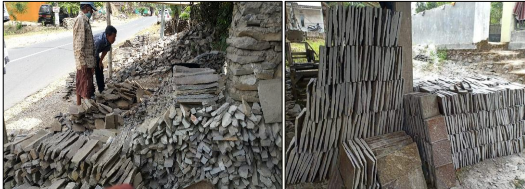
(a) Bentuk Batu Piring yang Dihasilkan Ukurannya Tidak Standar

Dusun Krajan II adalah batu piring yang banyak digunakan sebagai Furniture dan bahan bangunan. 2