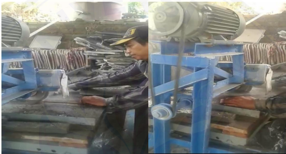
Gambar 9. Proses Pemotongan Batu Menggunakan Alat Yang Telah Di Modifikasi

dipotong semenarik mungkin, untuk batu yang digunakan sebagai lantai akan di potong berbentuk kotak-kotak dan dijual dengan harga per-meter. Sementara untuk batu piring yang digunakan sebagai furniture dinding akan dipotong abstrak dengan mempertahankan tekstur alami batu dan dijual dengan harga per-ton. Berikut merupakan prose pemotongan batu piring yang dilakukan secara langsung oleh Pak Abdulla dengan menggunakan mesin yang telah dimodifikasi sebelumnya.