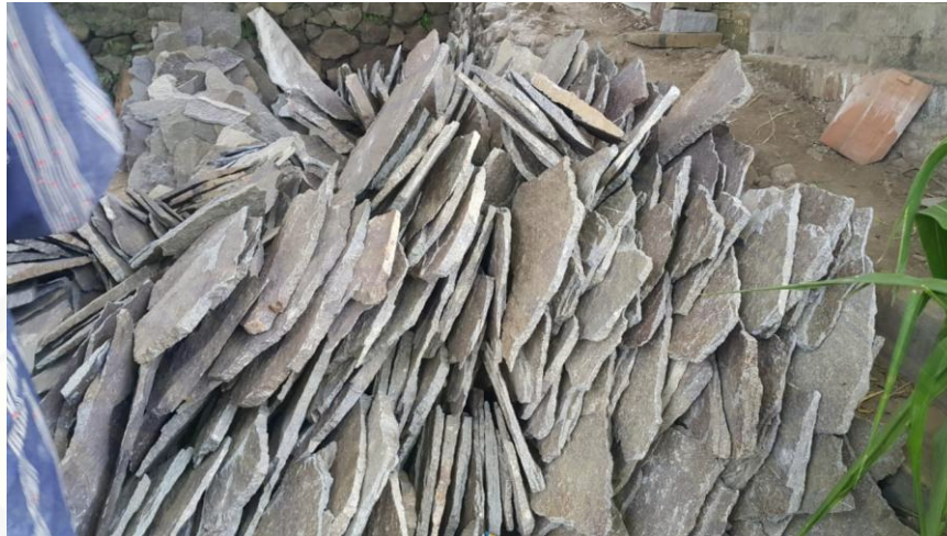
Gambar 8. Batu Piring Yang Belum Diolah Oleh Pengerajin Batu Piring

Gambar 8. menunjukkan kondisi batu piring mentah yang diperoleh dari pihak penambang batu piring. Pada Gambar 8. juga dapat dilihat bahwa kondisi batu piring mentah yang diperoleh oleh mitra memiliki ukuran dan bentuk yang berbeda-beda. Bahan batu piring mentah yang digunakan oleh mitra diperoleh dari penambangan batu piring yang ada di wilayah sekitar di Kecamatan Jelbuk dan Kecamatan Kalisat. Sehingga perolehan faktor produksi berupa batu piring mentah cenderung mudah didapatkan oleh mitra dan membutuhkan biaya faktor produksi yang lebih kecil karena jarak antara tempat produksi dan sumber faktor produksi yang relatif dekat.