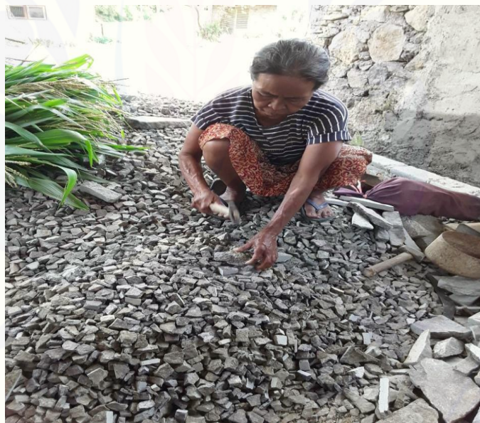
Gambar 11. Proses Produksi Batu Koral dari Sisa Pemotongan Batu Piring

dapat menambah difersifikasi produk yang dihasilkan. Selain itu, mitra juga dapat melakukan efisiensi waktu produksi karena dengan menggunakan mesin pemotong batu piring proses produksi jadi lebih mudah dan membutuhkan waktu yang jauh lebih singkat. Oleh karena itu, dengan adanya efisiensi waktu dalam proses produksi, mitra juga dapat meningkatkan produktifitasnya dalam menghasilkan kerajinan Batu Piring. Selain itu sisa dari potongan batu piring yang dihasilkan oleh mitra juga diolah kembali menjadi batu koral sehingga secara keseluruhan bahan batu piring yang diperoleh dan diolah oleh mitra memiliki nilai ekonomis. Proses pengolahan batu koral yang dilakukan oleh mitra masih menggunakan alat yang sederhana atau alat manual berupa palu seperti yang di tunjukkan dalam Gambar 11 sebagai berikut.