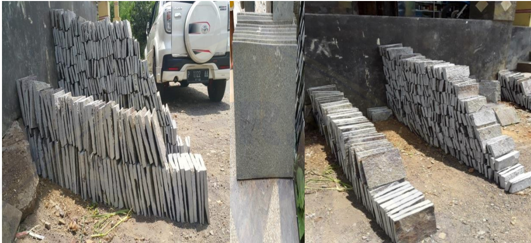
Gambar 10. Hasil Produksi Kerajinan Batu Piring dengan Menggunakan alat Pemotong Batu Piring

dan juga lebih rapi, adapun produk yang di hasilkan oleh mitra yaitu Batu piring yang digunakan untuk Lantai dan Batu Piring yang digunakan sebagai hiasan dinding.