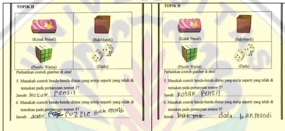
Gambar 2. Hasil Jawaban Kedua Subjek Topik II

asimilasi saat memahami pertanyaan. Meskipun pada awalnya S2 sempat mengalami disequilibrium karena hanya diam saja. Tetapi setelah beberapa menit S2 mampu beradaptasi dengan mampu menjawab pertanyaan yang diberikan. Hal ini terlihat dari sikap dan hasil jawaban pada masing-masing subjek. Ketika selesai mengerjakan lembar kerja topik II, kedua subjek menjawab pertanyaan pada topik II dengan benar setelah ditanyakan lebih lanjut. Kedua subjek juga menjawabnya dengan terlebih dahulu memikirkan apakah jawabannya benar atau tidak. Selain itu ketika sudah lebih paham apa yang ditanyakan, Kedua subjek juga dapat menyebutkan contoh benda mirip balok dan kubus lainnya dalam kehidupan sehari-hari dengan benar. Berikut Gambar 2 hasil jawaban kedua subjek pada topik II.