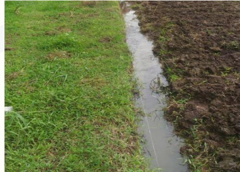
d.) Persiapan Lahan