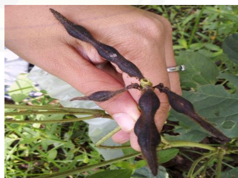
h.) Polong V2D7