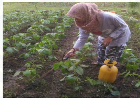
f.) Perawatan tanaman