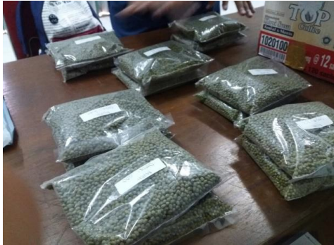
a.) Persiapan Benih sebelum irradiasi