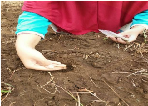
e.) Penanaman Benih Kacang Hijau