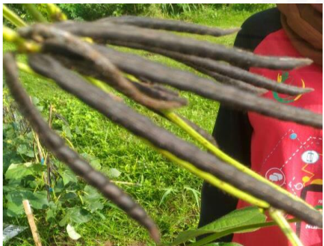
g.) Polong V1D3