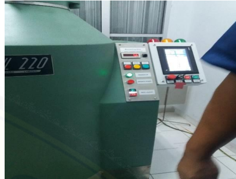
b.) Proses Irradiasi Sinar Gamma