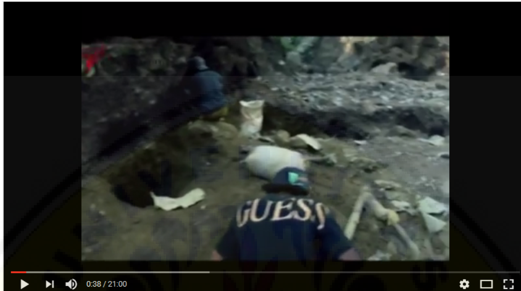
Gb. 4.4. Suasana penambangan liar di sekitar Meru Betiri