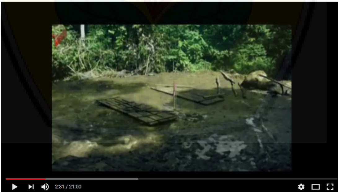
Gb.4.5. Situasi penambangan liar di sekitar Meru Betiri