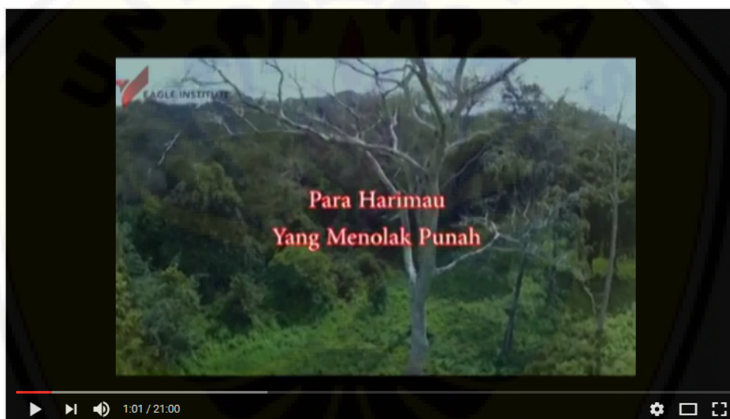
Gb. 4.1. Judul Film (sumber: https://www.youtube.com/watch?v=rUUHg2Jb4zs )