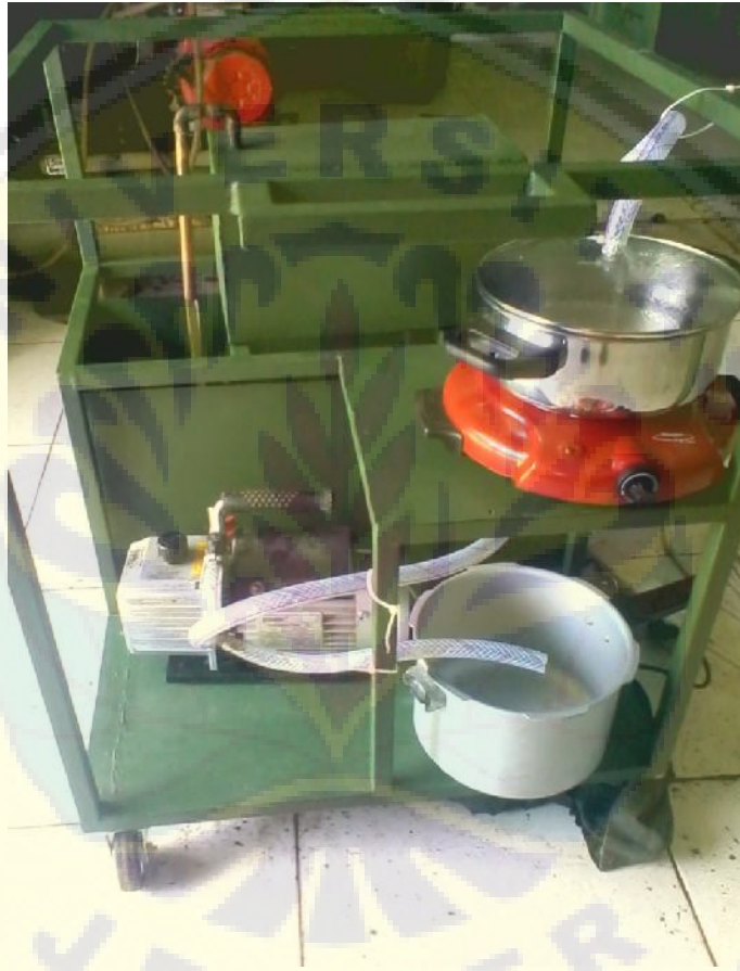
Gambar 1. Rangkaian alat evaporator ekstrak herbal.