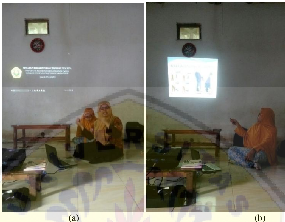
(a) (b) Gambar 1. Sosialisasi program pengabdian (a) dan penyuluhan kesehatan dan keselamatan kerja (b)

Bantuan modal berupa mesin peruncing dan mesin poles tusuk sate juga telah diserahkan kepada Posdaya Karang Paiton. Mesin peruncing tusuk sate sebanyak 3 unit diterimakan terlebih dahulu (Gambar 2a). Disusul dengan mesin poles tusuk sate sebanyak 1 unit yang diserahkan kemudian (Gambar 2b). Masyarakat di Posdaya Karang Paiton sangat antusias dengan hibah kedua mesin tersebut, bahkan beberapa orang yang tadinya hanya ibu rumah tangga biasa dan tidak membuat tusuk sate, sekarang juga ikut berpartisipasi dalam pembuatan tusuk sate. Diharapkan ke depan, semakin banyak masyarakat yang bergabung dengan kegiatan Posdaya Karang Paiton sehingga kesejahteraan mereka juga semakin meningkat.