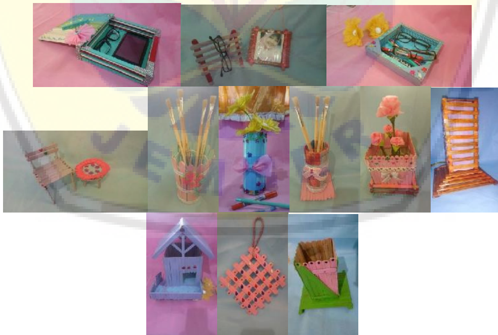
Gambar 3. Hasil kerajinan tangan dari limbah bambu

Pelatihan pembuatan kerajinan tangan dari limbah tusuk sate juga diikuti dengan antusias. Bantuan modal berupa peralatan kerajinan tangan juga sudah diserahkan. Peserta antusias mengikuti pelatihan pembuatan kerajinan tangan dari limbah tusuk sate. Setiap orang juga mengerjakan tugas yang diberikan oleh tim pelaksana, berupa membuat kerajinan tangan tiap orang 1 buah. Beberapa orang bahkan membuat lebih dari 1 buah kerajinan tangan (Gambar 3). Hasil kerajinan tangan yang mereka buat selanjutnya didokumentasi, dibuat katalog, dan dipasarkan melalui media sosial, Facebook.