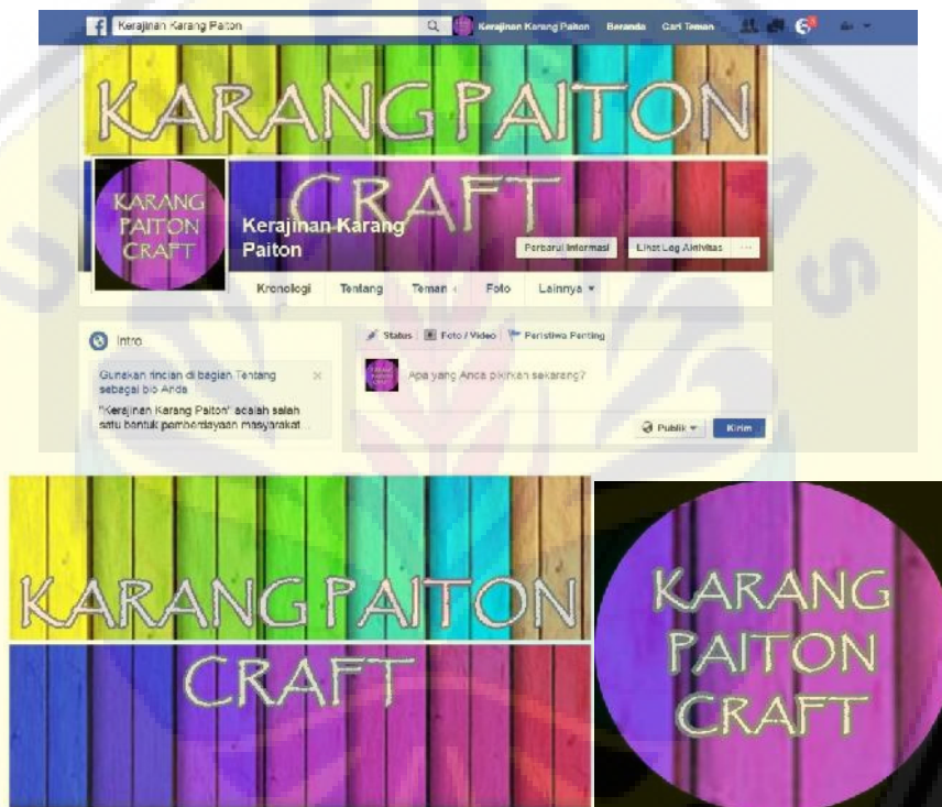
Gambar 4. Tampilan laman Facebook Karang Paiton Craft ( https://www.facebook.com/karangpaiton.craft )

Pelatihan pemasaran online meliputi teknik dokumentasi, pembuatan katalog online, dan pemasaran melalui Facebook juga diberikan kepada anggota Posdaya Karang Paiton. Tidak semua orang di daerah tersebut menggunakan Facebook, sehingga pelatihan diberikan kepada satu orang yang sudah familiar dengan Facebook dan ditunjuk oleh ketua Posdaya Karang Paiton untuk menjalankan tugas sebagai tenaga pemasaran online. Laman Facebook Posdaya Karang Paiton dapat diakses di https://www.facebook.com/karangpaiton.craft (Gambar 4).