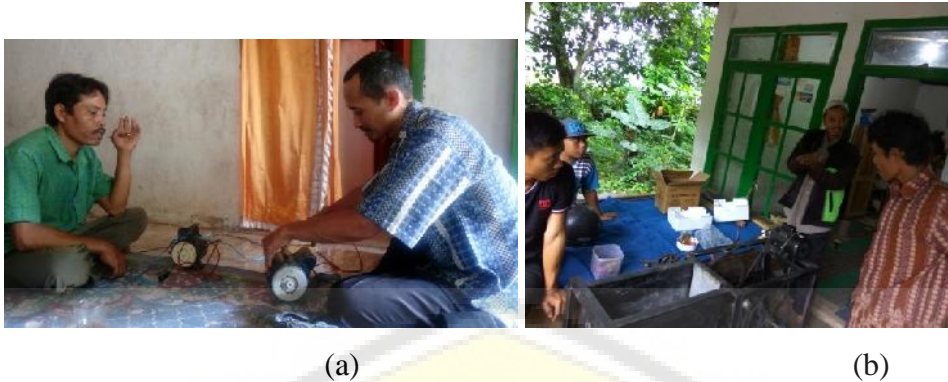
Gambar 2. Serah terima alat peruncing (a) dan alat poles (b) tusuk sate

Pelatihan pembuatan kerajinan tangan dari limbah tusuk sate juga diikuti dengan antusias. Bantuan modal berupa peralatan kerajinan tangan juga sudah diserahkan. Peserta antusias mengikuti pelatihan pembuatan kerajinan tangan dari limbah tusuk sate. Setiap orang juga mengerjakan tugas yang diberikan oleh tim pelaksana, berupa membuat kerajinan tangan tiap orang 1 buah. Beberapa orang bahkan membuat lebih dari 1 buah kerajinan tangan (Gambar 3). Hasil kerajinan tangan yang mereka buat selanjutnya didokumentasi, dibuat katalog, dan dipasarkan melalui media sosial, Facebook.