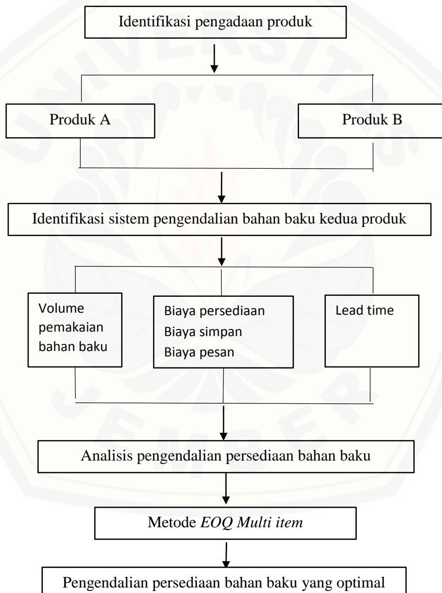
Gambar 2.2 Kerangka Konseptual Penelitian

Adapun kerangka konseptual dalam penelitian ini dapat dilihat pada gambar 2.2 berikut ini: