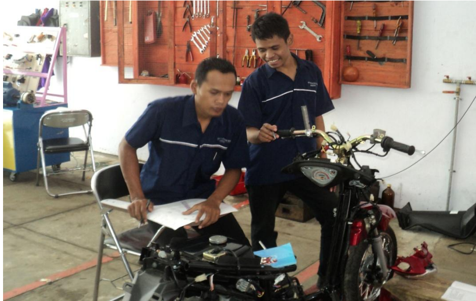
Foto 1.8 Foto saat bongkar mesin