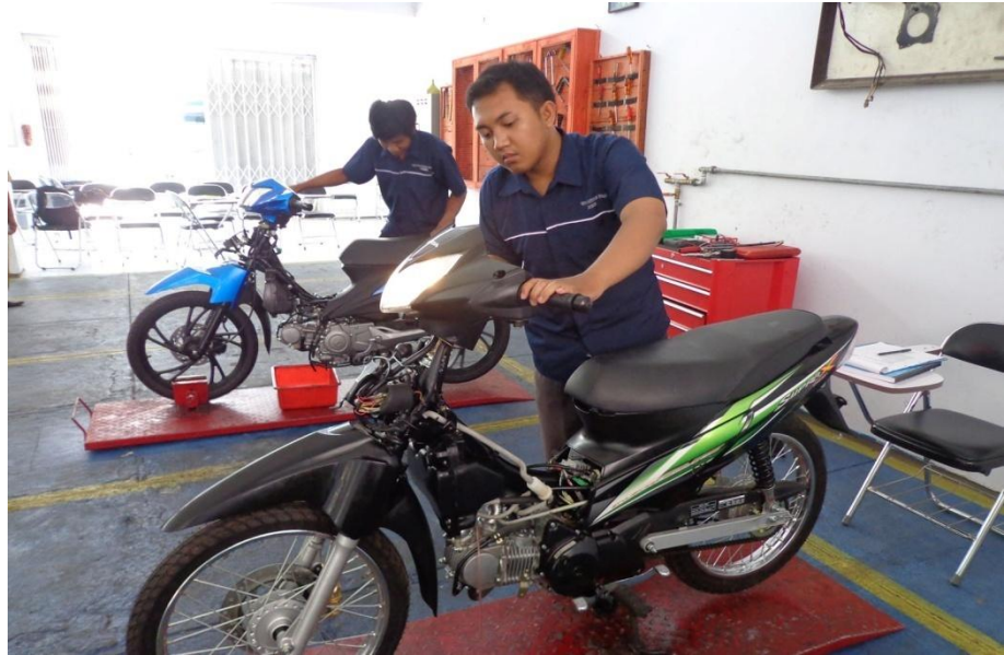
Foto 1.4 Foto saat praktek bongkar awal