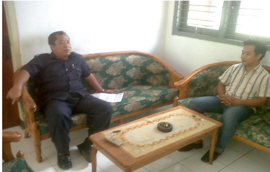
Foto 1.2. Foto di depan LIPOSOS