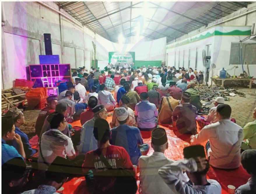
Gambar 2 kegiatan majelis ngaji ngopi

Di Kawasan dusun Cangaan sendiri terdapat banyak sekali komunitas dakwah bagi para remaja yang dibungkus sedemikian rupa proses pembelajarannya agar dapat mudah dipahami oleh para kawula muda. Komunitas ini menjadi sangat berkembang pesat pada tahun-tahun ini melalui obrolan daripada setiap grup wa yang dimiliki oleh para pemuda Cangaan. Untuk komunitas pengajian paling besar disini terdapat namanya ngaji ngopi. Ngaji ngopi sendiri merupakan program yang diadakan oleh para pemuda Cangaan yang dipimpin oleh para pendakwah muda dengan melalui ngaji dengan santai. Menurut burhanudin dan kamalia dalam jurnal tentang budaya santri bahwasanya diskusi maupun penyerapan ilmu agama yang paling banyak diterima oleh santri adalah Ketika saat para santri dapat berdiskusi dengan santai dengan meminum kopi. Budaya santri tersebutlah yang kemudian diterapkan oleh para kelompok santri di dusun cangaan untuk kemudian dapat menarik minat para pemuda untuk mengikuti kegiatan ngaji dan ngopi dalam membahas permasalahan-permasalahan agama yang ada di dusun cangaan. (Burhanudin & Kamalia, n.d.)