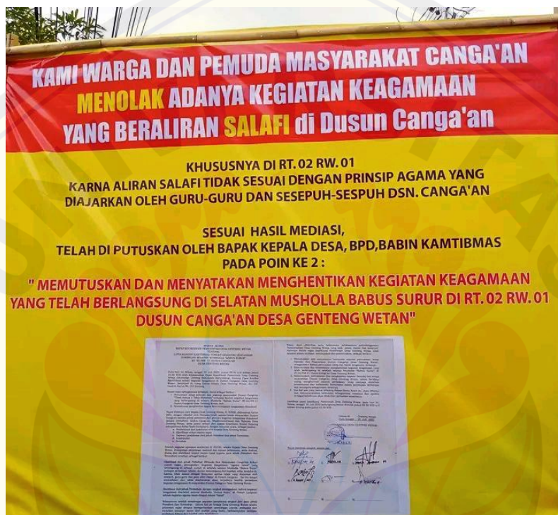
Gambar 1. penolakan masyarakat kepada kelompok salafi wahabi

Mereka membiarkan dan tak pernah ada diskriminasi terhadap golongan salafi secara verbal karena mereka juga mengetahui dari aspek tinjauan hukum nasional. Namun tidak dapat dipungkiri bahwasanya mayoritas masyarakat dusun cangaan menjadi lebih diskriminatif bilamana dari golongan minoritas mengupayakan adanya dakwah. Dakwah yang berlangsung dari golongan salafi menjadi ketakutan luar biasa bagi masyarakat dusun cangaan. Mereka cenderung akan lebih resisten terhadap upaya dakwah yang dilakukan oleh golongan salafi.