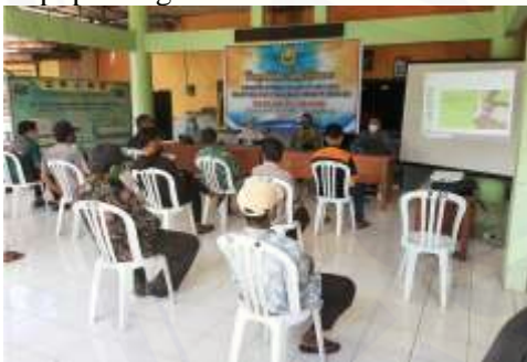
Gambar 5 Antusiasme peternak dalam sosialisasi

Sosialisasi manajemen budidaya ternak untuk keperluan breeding dilakukan dengan dihadiri sebanyak 20 peternak. Materi yang diberikan berupa manajemen recording, pengolahan pakan ternak dengan metode fermentasi dan optimalisasi teknologi inseminasi buatan untuk mendapatkan kualitas anakan yang unggul serta materi pemanfaatan kotoran ternak untuk diolah menjadi pupuk organik.