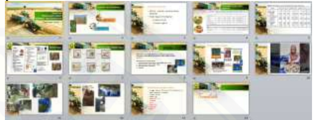
Gambar 2 materi sosialisasi

Sosialisasi, diskusi dan tanya jawab dengan peternak dalam manajemen pengelolaan limbah peternakan.