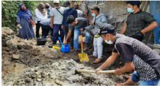
Gambar 7 proses pengolahan limbah kotoran ternak