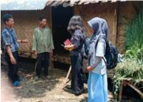
Gambar 1 Diskusi dengan peternak desa Klabang

Kotoran ternak merupakan bahan organik yang berkualitas untuk dapat dijadikan sebagai pupuk (Suniarta et al., 2019). Pupuk organik dapat diolah dari tanaman maupun hewan menjadi hara yaitu C-Organik yang bermanfaat dalam pembenahan tanah (Suriadikarta et al. 2006). Terdapat dua jenis pupuk organik berdasarkan bentuknya yaitu pupuk padat dan pupuk cair (Putra dan Ratnawati, 2019). Pupuk organik memiliki fungsi sebagai penyubur tanaman dan juga menyediakan nutrisi bagi tanaman (Suniarta et al., 2019).