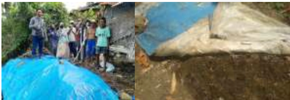
Gambar 8 proses fermentasi limbah kotoran ternak dan hasil fermentasinya

Peningkatan kesadaran peternak akan pentingnya pelestarian lingkungan memicu para peternak untuk melakukan pengolahan kotoran ternak dan limbah organik yang ada. Harapan besar bagi para peternak yang juga memiliki usaha di bidang pertanian yaitu mampu menerapkan konsep pertanian organik. Pertanian organik erat kaitannya dengan Kesehatan pangan dan saat ini tumbuh pesat di tingkat nasional dan global (Purwantini dan Sunarsih, 2019).