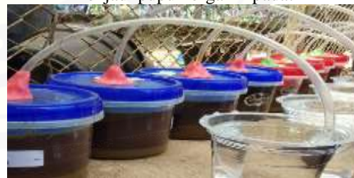
Gambar 4 pengolahan limbah urin ternak menjadi pupuk organik cair