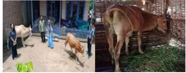
Gambar 6 pemeliharaan ternak secara semi intensif

limbah pertanian dan tanaman pohon di sekitar rumah warga.